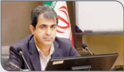
از سازمان خصوصی سازی و دولت طلب دارد.

رئیس هیات عامل ایمیدرو تاکید کرد: این سازمان تاکنون چنین حجمی از بدهی ها را پرداخت نکرده بود آن هم در شرایطی که بابت واگذاری های پیشین