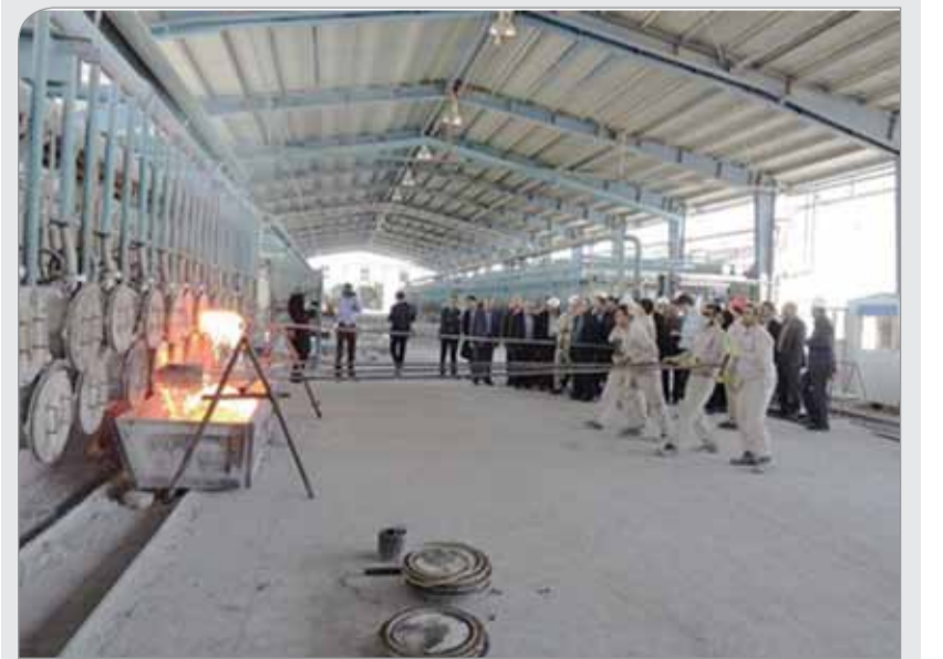
شرح: مشکلات فعلی بازار فولاد