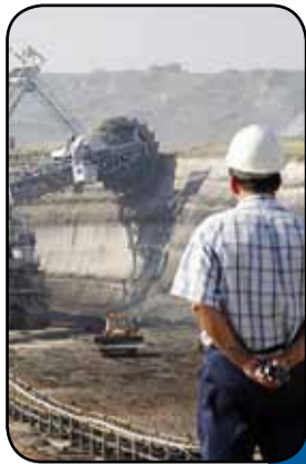
کرونا اکتشافات را لغو کرد