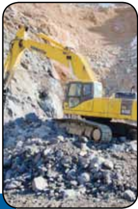
جهش تولید با احیای معادن کوچک مقیاس