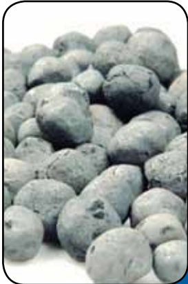
سنگ اندازی در صادرات آهن اسفنجی