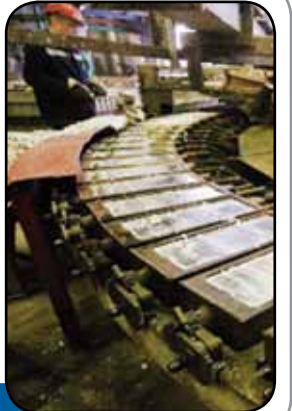
تعطیلی در کمین واحدهای تولیدی شمش روی