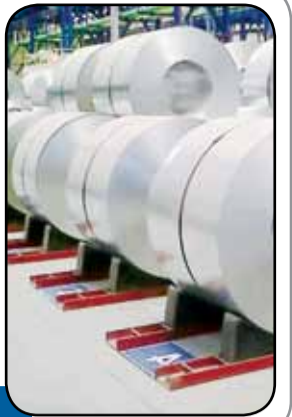
فقط ۱ درصد از تولید فولاد در بورس کالا عرض شد!