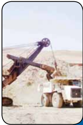
استراتژی معدنی‌ها در توسعه مسئولیت اجتماعی