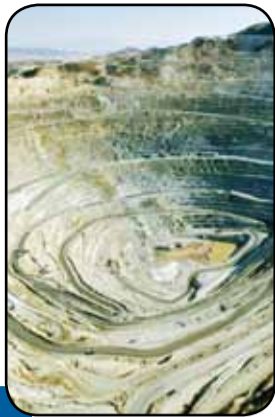
پیشنهاد تشکیل انجمن قطعه سازان معدن و صنایع معدنی