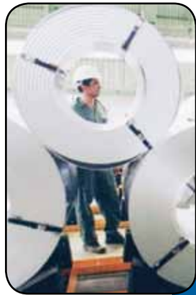
خلاهای تولید ورق سرد فولادی