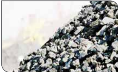
در نتیجه تقاضا برای سنگ‌آهن بالای استرالیا رو به کاهش است. با این حال صادرات در ماه آوریل نسبت

به آوریل سال گذشته که ۶۹.۲۲ میلیون تن بود، رشد داشته است. این رشد به دلیل تاثیر طوفان استرالیا در مارس ۲۰۱۹ بوده که باعث کاهش حجم صادرات سنگ‌آهن این کشور شده است.