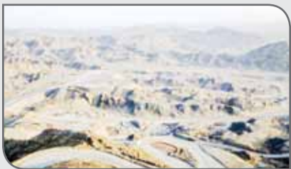
برای همکارانم در صندوق بیمه سرمایه‌گذاری فعالیت‌های معدنی آرزوی توفیق بیش از پیش دارم.