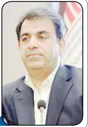
تعیین تکلیف معادن مس غیر فعال تا ۱۵ خرداد