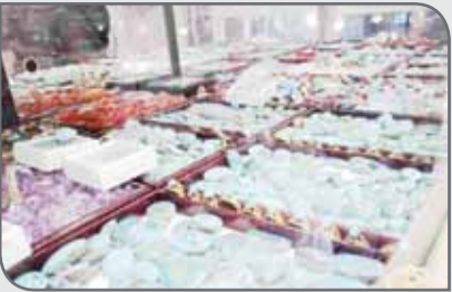
کشور قرار دارد که این کارگاه‌های طلاسازی و نقره‌سازی همچنین بخش فیروزه کوبی را شامل می‌شود.

این کمیته درصدد پیگیری برندسازی و اصلاح نظام تعرفه هستیم به شکلی که قیمت روی فلز از سوی بانک مرکزی در مرکز و نمایندگان آن بانک در استان‌ها انجام شود. گفتنی است که اصفهان یکی از استان‌های با ظرفیت بالای معدنی کشور، حدود ۸۴۰ معدن در حال بهره‌برداری با سرمایه‌گذاری بیش از ۱۰ هزار میلیارد ریال دارد که حدود ۴۰۰ واحد آن سنگ‌های تزئینی است و از لحاظ تعداد تراشیده سنگ قیمتی و مصرف، در رتبه دوم