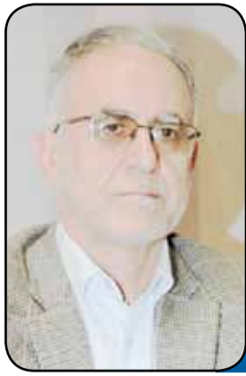
حمایت ایمیدرو از صنعت سنگ