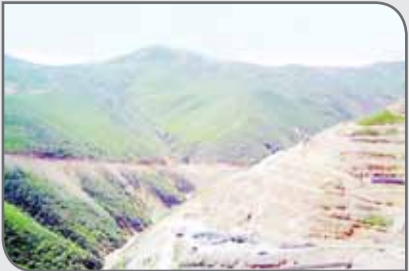
مشکلات زیست محیطی این مجموعه را از نزدیک بررسی و دستورهای لازم برای رفع مشکلات را صادر کرد.

و بازسازی معدن است. قاسمی در ادامه با تقدیر از اقدامات زیست محیطی معدن مس سونگون گفت: عدم مدیریت صحیح در تمامی صنایع و معدن می‌تواند باعث آلودگی محیط‌زیست شود. به گزارش روابط عمومی اداره کل حفاظت محیط‌زیست آذربایجان شرقی، در ادامه مدیرعامل مس آذربایجان، مشاوران علمی و دانشگاهی معدن مذکور نیز مطالبی را عنوان و مدیر کل حفاظت محیط‌زیست استان از اقدامات زیست محیطی معدن بازدید و مسائل و