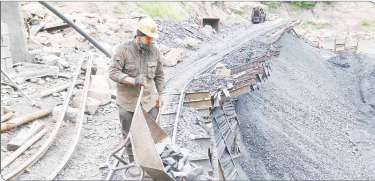
عکس: روزگار معدن

این مورد، موارد مهم و البته پیش‌پا افتاده‌ای است که متأسفانه معدنکاران ما به‌دلیل نبود توجه لازم به مباحث حقوقی همواره از جانب آن در معرض خطر هستند. از وقتی کمیته حقوقی و داوری خانه معدن ایران راه‌اندازی شده، به‌دنبال این هستیم که فرهنگ‌سازی گسترده‌ای برای فعالان معدنی در زمینه ماده ۲۴ انجام دهیم و راهکارهایی مطرح کنیم که باعث شود فعالان معدنی از مشکلات حقوقی به سلامت خارج شوند. امیدواریم بتوانیم مسیری را طی کنیم که امنیت سرمایه‌گذاری در سطح کشور برای فعالان معدنی تأمین شود.