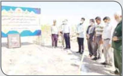
ساخت منزل یاد شده تا ۳ ماه آینده به اتمام رسیده و آماده بهره‌برداری شود.

شرکت فولاد خوزستان در راستای ایفای مسئولیت‌های اجتماعی و محرومیت زدایی، با حضور سرهنگ عبدالرضا حاجتی معاون هماهنگ‌کننده سپاه حضرت ولیعصر (عج) و علی محمدی، مدیرعامل فولاد خوزستان، ۱۰ تیرماه ۱۳۹۹ ساخت یک باب منزل مسکونی در منطقه محروم گلدشت شهرستان اهواز را آغاز کرد. به گزارش فولاد خوزستان، عبدالرضا حاجتی معاون هماهنگ‌کننده سپاه حضرت ولیعصر (عج) با تشکر از مدیرعامل فولاد خوزستان در ایفای مسئولیت‌های