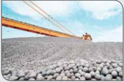
۷۵۰ تن (۸ درصد) و کنسانتره ۳ میلیون و ۹۵۵ هزار و ۹۹۲ تن (۴ درصد کاهش) بود.

سال جاری، با ۲ درصد افزایش نسبت به مدت مشابه سال گذشته، ۱۱ میلیون و ۲۳۵ هزار و ۱۲۴ تن محصول تولید کردند. در ۳ ماهه نخست ۹۹، در بخش کنسانتره ۱۱ میلیون و ۹۱۳ هزار و ۵۳۶ تن تولید شد که ۲ درصد کاهش یافت. میزان تولید شرکت‌های بزرگ فولادی در خرداد ۹۹ در بخش شمش یک میلیون و ۹۴۶ هزار و ۶۱۹ تن (۸ درصد رشد)، محصولات فولادی یک میلیون و ۱۷۴ هزار و ۶۷ تن (۲ درصد کاهش)، آهن اسفنجی ۲ میلیون و ۶۶۱ هزار و ۴۶۶ تن (۱۶ درصد رشد)، گندله ۴ میلیون و ۷۹ هزار و