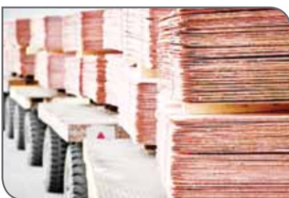
کنسانتره مس کشور و خاورمیانه خواهد بود عملیاتی شود.