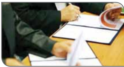
از سوی معدنکاران، تفاهنامه‌ای میان صندوق بیمه سرمایه‌گذاری فعالیت‌های معدنی و صندوق کارآفرینی

و توافق‌های مربوطه در جهت تأمین سرمایه در گردش به معرفی‌شدگان صندوق بیمه سرمایه‌گذاری فعالیت‌های معدنی، در قبال تضمین بیمه‌نامه اعتباری و صادرشده از سوی صندوق بیمه، منعقد شد. گفتنی است کارمزد تسهیلات برای طرح‌ها، با نرخ ۵۴ درصد به مناطق روستایی و عشایری مرزی و ۶۰ درصد به روستاهای غیرمرزی و عشایری غیرمرزی است. صندوق بیمه سرمایه‌گذاری فعالیت‌های معدنی یکی از ارکان اصلی این طرح است و این توافقنامه‌ها جزو الزامات پیشبرد اهداف در بخش تأمین منابع مالی، جهت ایجاد اشتغال پایدار در بخش روستایی و عشایری است.