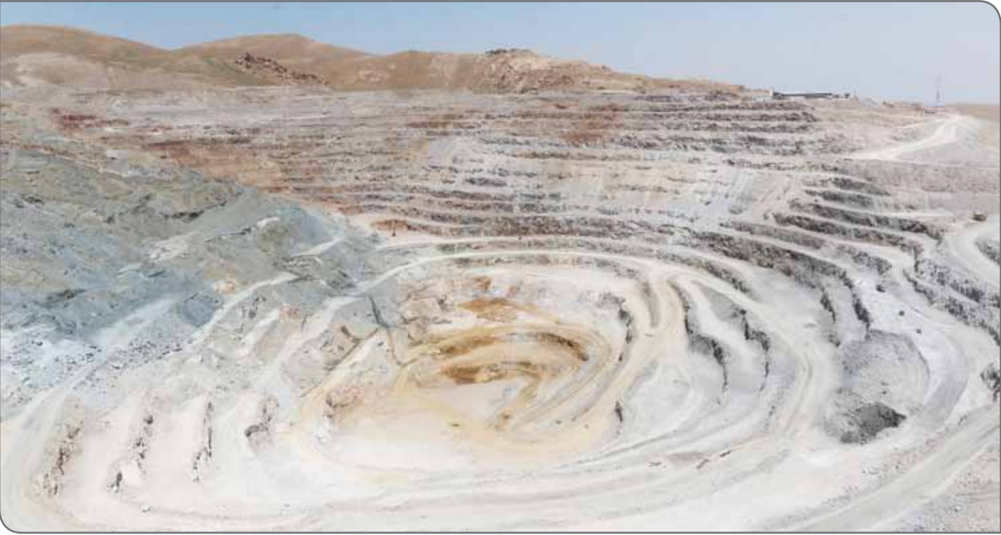
عکس: روزگار معدن

■ ضرورت تبدیل ایده‌ها به محصول پیشینه تحقیقات و پژوهش‌ها در حوزه دانشگاه‌ها گویای آن است که بسیاری از این تلاش‌ها، گستره قفسه کتابخانه‌ها را فراتر طی نکرده و سال‌ها عمر جوانان کشور در صحنه اجراء کاربردی نداشته، امروز باور همگانی بر این اصل تکیه دارد که تحقیق و پژوهش و ایده‌های جوانان باید تبدیل به محصول شود.