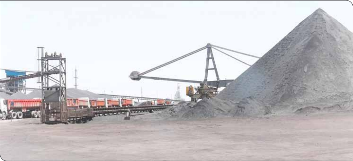
عکس: ژوژگار معدن

ممنوع کند. این اقتصاددان بیان کرد: طبق مطالعاتی که از سوی بزرگ ترین شرکت تولیدکننده فولاد کره جنوبی پس از امضای برجام برای سرمایه گذاری در صنعت فولاد ایران انجام شد، مشخص شد که بنادر ایران ظرفیت پهلوگیری برای کشتی های پیش از ۱۰۰ هزار تن را ندارد، درحالی که کشتی هایی که به کشورهای اروپایی وارد می شود، بیش از ۳۰۰هزار تن ظرفیت دارد. علاوه بر آن معادن ایران غیرعلمی مورد بهره برداری قرار می گیرد و این امر هزینه بهره وری در معادن ایران را افزایش می دهد.