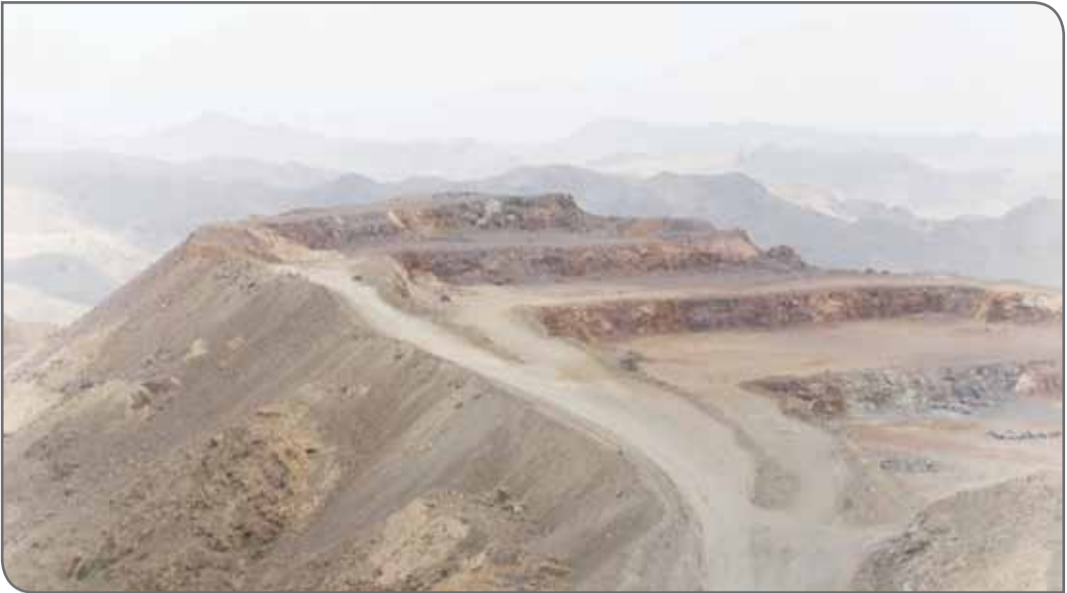
معدن زئود در استان خراسان جنوبی