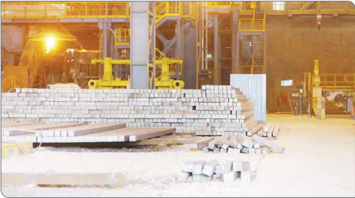
عزم دولت و مجلس برای کاهش قیمت سیمان و فولاد

انجام می‌دهیم و قطعاً حضور در نمایشگاه نیز یکی از فعالیت‌های اجتماعی به شمار می‌رود. قطعاً در چنین شرایطی حضور در این فضاها کمی دشوار است اما زمانی که عنوان می‌شود استفاده از ماسک به جلوگیری از انتشار ویروس کمک خواهد کرد با رعایت پروتکل‌های بهداشتی می‌توانیم شاهد برپایی این نمایشگاه باشیم.