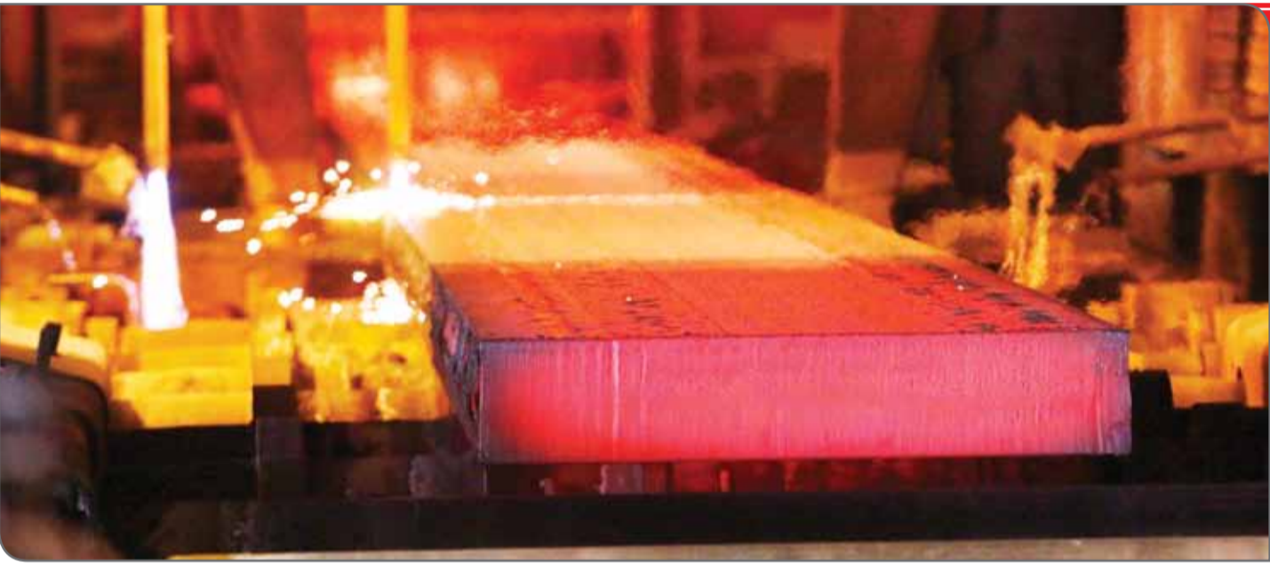
عکس‌ها: روزگار معدن