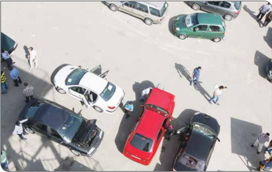
نمای هوایی بازار فولاد

در همین زمینه کیوان گردان، مدیرکل صنایع فلزی و لوازم خانگی وزارت صنعت، معدن و تجارت در یک برنامه تلویزیونی گفت: معاونت امور صنایع وزارت صنعت، معدن و تجارت متولی