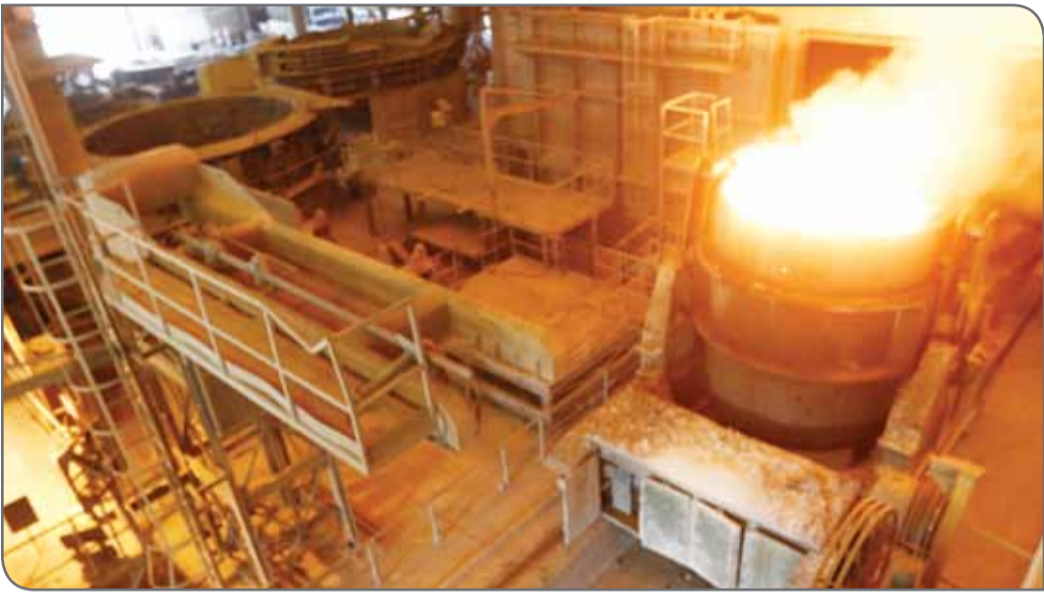
تصویری از یک کوره ذوب فولاد در حال کار، با نور آبی و نارنجی درخشان.