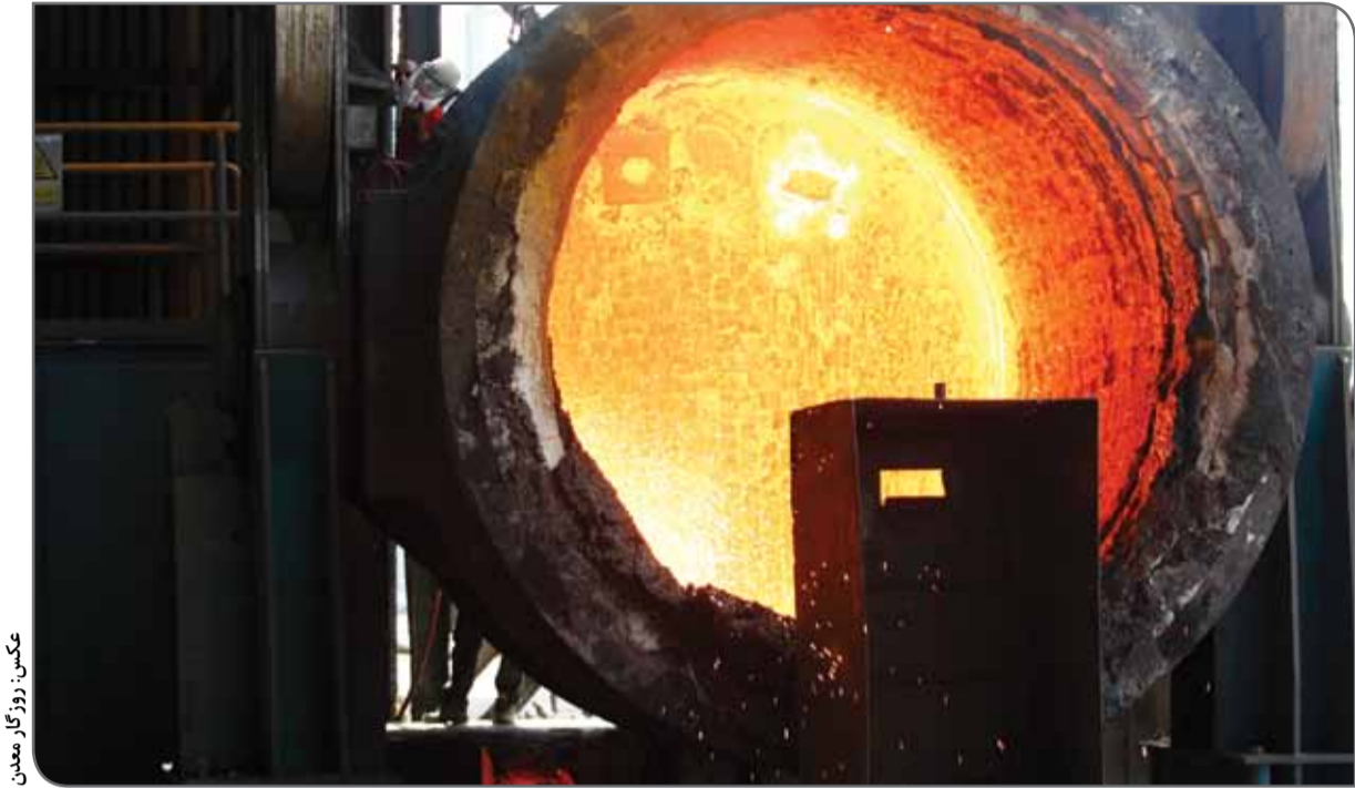
عکس، روزگار معدن