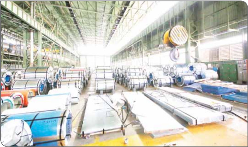
نمایانگران، شرایط انجام تعهدات وحمل‌ونقل بارهای خریداری شده و تحویل آنها به شرکت‌ها و به‌طور کلی دست‌یابی به اهداف برنامه‌ریزی‌شده با روند بهتری انجام شود.

پیمانکاران، شرایط انجام تعهدات وحمل‌ونقل بارهای خریداری شده و تحویل آنها به شرکت‌ها و به‌طور کلی دست‌یابی به اهداف برنامه‌ریزی‌شده با روند بهتری انجام شود.