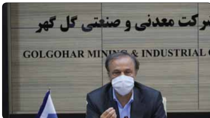
فاز نخست مگا پروژه انتقال آب از خلیج فارس به فلات مرکزی به بهره‌برداری رسید