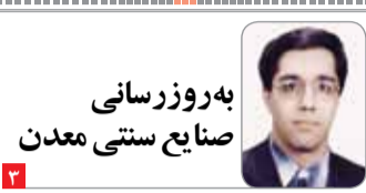
به‌روزسانی صنایع سنتی معدن