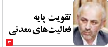
تقویت پایه فعالیت‌های معدنی