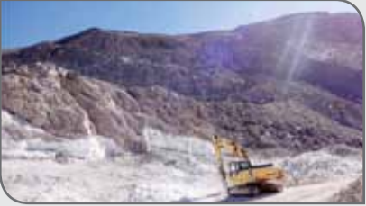
کرونا از دیگر اقدامات این مدیریت در حوزه معدن است.

بزرگی به نتیجه برسد. وی با بیان اینکه ۲ معدن راکد سال‌های گذشته نیز با پیگیری‌های این مدیریت فعال شده است، اظهار کرد: نظارت بر فعالیت‌های معدنی و جلوگیری از تخریب معادن و استخراج غیراصولی و برداشت‌های غیرمجاز و رعایت مسئله دید و منظر، پیگیری در خصوص ایجاد نمایندگی سازمان نظام مهندسی معدن، کمک به شکل‌گیری خانه معدن منطقه آزاد ماکو و انجام امور و فرآیندها تا حدود زیاد و حتی الامکان از طریق سامانه کاداستر و بدون نیاز به حضور متقاضی و در نظر گرفتن ملاحظات مربوط به بیماری