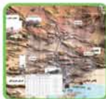
قطعه اول انتقال آب

از محدوده مجتمع معدنی و صنعتی گل گهر شروع و صنایع مس سرچشمه ادامه دارد.