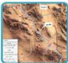
قطعه سوم انتقال آب

این بخش از پروژه شامل احداث ایستگاه‌های پمپاژ و ۸۲۰ کیلومتر خط انتقال آب از محل تاسیسات آب شیرین کن بندر عباس به صنایع منطقه گل گهر، مس سرچشمه و چادملو در استانهای کرمان و یزد در قالب سه قطعه است. مشخصات هر قطعه به شرح ذیل است.