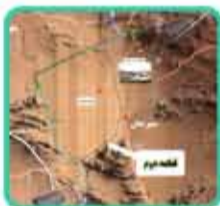
قطعه دوم انتقال آب

از محدوده مجتمع مس سرچشمه و صنایع فولادی چادملو در استان یزد ادامه دارد.