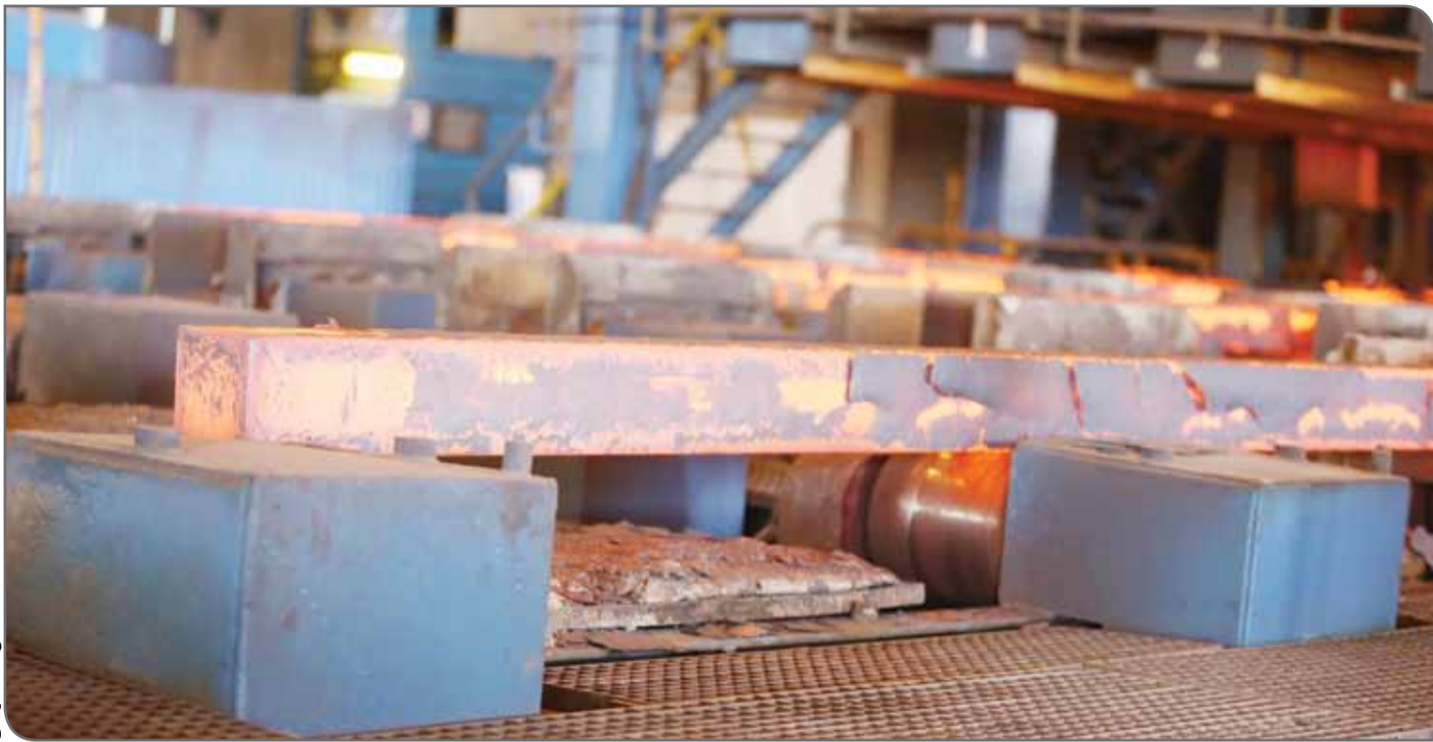
عکس: آیدا فریدی