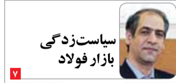
سیاست‌زدگی بازار فولاد