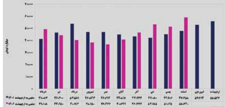
ارزش بازار صورت وضعیت پرتفوی شرکت‌های بورسی «تاسیکو»

صورت‌وضعیت پرتفوی شرکت‌های «بورسی» ارزش بازار سرمایه‌گذاری‌های خود را بالغ‌بر ۵۸ هزار و ۷۴۰ میلیارد تومان به ثبت رساند که نسبت به بهای تمام‌شده سرمایه‌گذاری‌ها رشد ۹۲۷ درصدی را به همراه داشت.