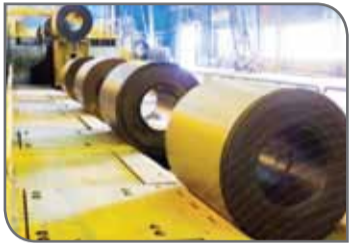
عکس‌ها: روزگار معدن

«فولاد سبا» بر ای تولید ۲ میلیون تن کلاف گرم