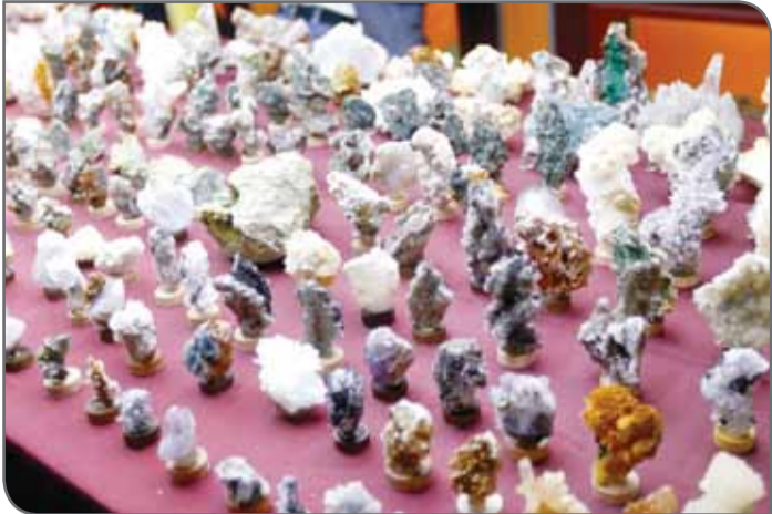
عکس‌ها: روزگار معدن

در ESG در معدن به ۳ مورد عوامل زیست‌محیطی، اجتماعی و حکومتی مربوط می‌شود. از اثرات زیست‌محیطی