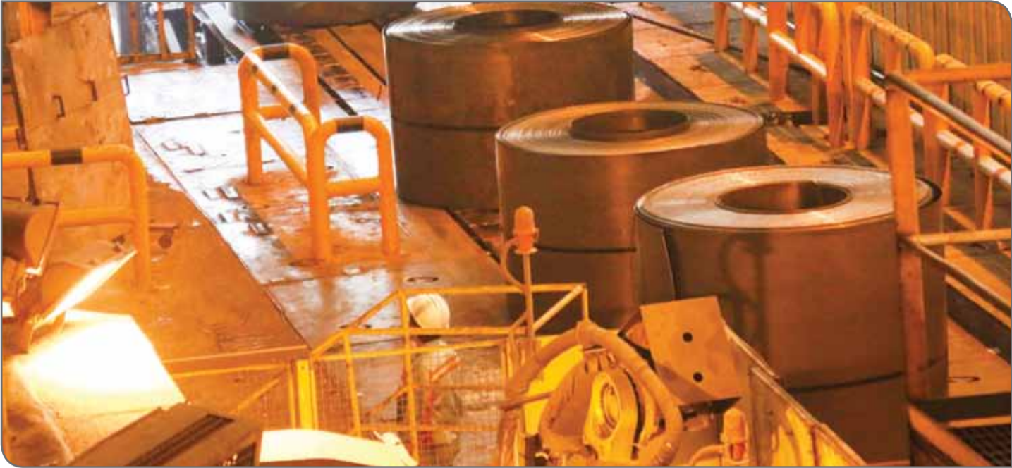
عکس‌ها: روزگار معدن