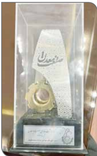
لازم به ذکر است که با همت این شرکت قادر به خودکفایی استان یزد در حوزه فرآوری مواد اولیه شیشه و بلور خواهیم بود.