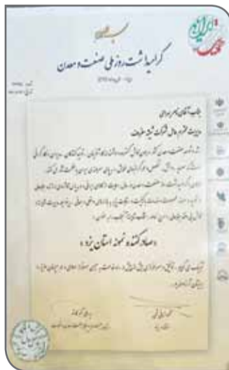
تایید و حمایت مقامات دادگستری استان و دادستانی هم قرار گرفته است و متعهد به رعایت تمام شیوه‌نامه‌های محیط زیستی است؛