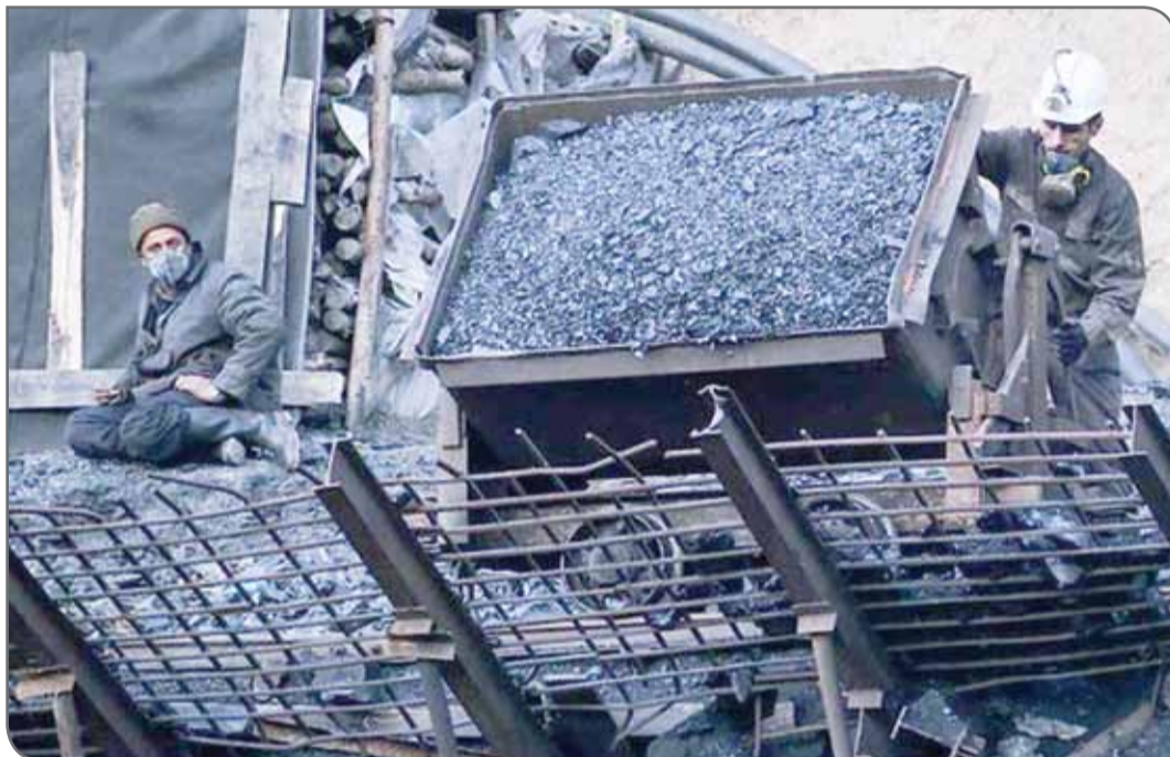
کاهش تورم می‌کند. با این وجود، دفتر نماینده تجاری ایالات متحده آمریکا از اظهار نظر در این باره خودداری کرد. پیش از این، بلومبرگ گزارش داده بود که پیش‌نویس اولیه توافق نامه معدنی اتحادیه اروپا و ایالات متحده ۵ ماده معدنی کبالت، گرافیت، لیتیوم، منگنز و نیکل را فهرست می‌کند که توسط این توافقنامه مستقل پوشش داده شده است. چنین مسئله‌ای، بازتاب توافقی است که دولت بایدن ماه گذشته با ژاپن امضا کرد.

به گفته افسران آگاه، توافق میان ایالات متحده آمریکا و اتحادیه اروپا بر سر مواد معدنی حیاتی، مزایای گسترده‌تری نسبت به آنچه که قبلاً تصور می‌شد، ایجاد کرده است. با این توافق، راه برای گشایش چندین مانع تجاری دیگر که توسط قانون بزرگ پارانه سبز جو بایدن ایجاد شده بود، هموار خواهد شد. به گزارش ایماسکو، تعدادی از مقامات آگاه که خواستند نام آنها فاش نشود، درباره توافق ایالات متحده و اتحادیه اروپا بر سر مواد معدنی حیاتی عنوان کردند که این توافق اساساً به شرکت‌های اتحادیه اروپا اجازه می‌دهد از برخی مزایای قانون کاهش تورم در مورد ۵۰ ماده معدنی که در قانون به عنوان مواد معدنی حیاتی شناخته می‌شوند، استفاده کنند. دولت بایدن گفته است که که کشورهای دارای قراردادها تجاری با ایالات متحده می‌توانند به برخی مزایای قانون کاهش تورم دسترسی باشند که حدود ۳۶۹ میلیارد دلار کمک مالی و اعتبار مالیاتی در دهه آینده برای برنامه‌های انرژی پاک در آمریکای شمالی ارائه خواهد کرد. به گفته برخی افراد، اگر معاهده مواد معدنی تصویب شود، معادل یک توافق تجارت آزاد خواهد بود و این وضعیت به نوبه خود خودروهایی برقی حاوی مواد معدنی حیاتی استخراج شده و فرآوری شده اتحادیه اروپا را واجد شرایط دریافت بارانه قانون