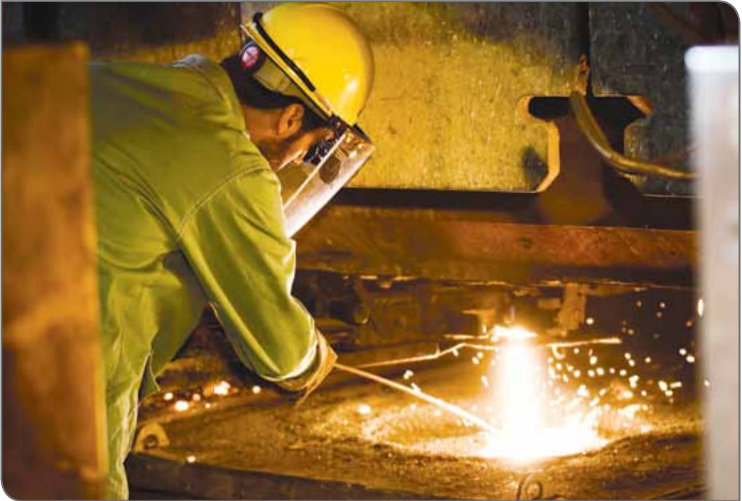
عکس‌ها: روزگار معدن

عملیات اجرایی این کارخانه آغاز و قرار بود با کمک چندین شرکت اصفهانی اورهسال ایجاد شود. وی ادامه داد: متأسفانه به دلیل اختلافات بین مالک و شرکت‌های مذکور آنان به تفاهم و نتیجه نرسیدند. نماینده مردم خرم‌آباد و چگنی در مجلس شورای اسلامی گفت: هم‌اکنون با مرتفع شدن برخی مشکلات کارخانه و با وجود سرمایه‌گذار جدید خط تولید راه‌اندازی و تا قبل از عید ۱۵۰۰ تن تولید داشتند. ویس کرمی با بیان