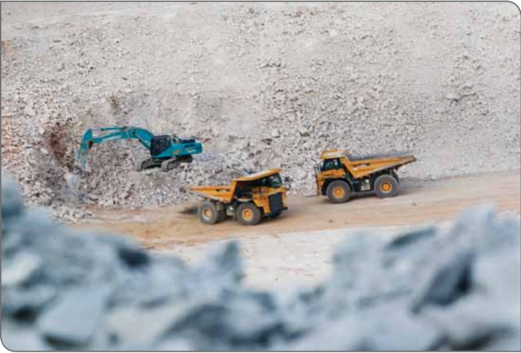
یک دستگاه تراکتور در معدن

عربی حاشیه خلیج‌فارس با وجود حجم کمی از ذخایر معدنی به نسبت ایران، برنامه بلند مدتی برای بخش معدن و صنایع معدنی تدوین کرده و به دنبال جذب سرمایه‌های داخلی و خارجی هستند تا از میزان وابستگی به درآمدهای نفتی کم کنند.