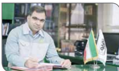
عرضه این محصول به دولت با مشکل روبه‌رو شدند و همین امر تولید برق در بخش خصوصی را با محدودیت مواجه کرد.

سرپرست معاونت فروش و بازاریابی شرکت فولاد مبارکه همچنین اظهار کرد: در سال گذشته عدم‌التفیع زیادی در تولید فولاد کشور وجود داشت و این امر شرایطی را فراهم آورد تا فولادسازان بتوانند بخشی از نیاز خود را به برق خودکفا و با سرمایه‌گذاری شخصی تامین کنند. در همین راستا فولاد مبارکه نیز در یک سال و نیم گذشته پروژه‌های خوبی را در زمینه تامین انرژی آغاز کرده است.