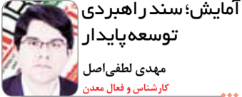
کارشناس و فعال معدن