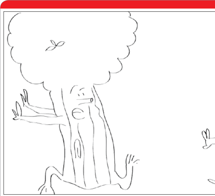
طرح: حسین عزیزاده