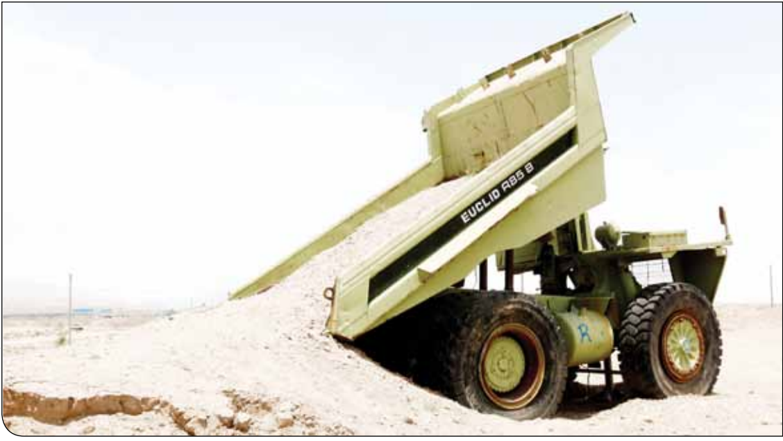
شه‌ر بار خادمی

بخش معدن برای تحقق رشد ۱۳درصدی در برنامه هفتم توسعه نیازمند تأمین زیرساخت‌های اصلی برای تولید است. اما امروز معدن کاران در بحث تأمین ماشین‌آلات با چالش‌های جدی مواجه هستند که به‌طور مستقیم میزان تولید را نشانه گرفته‌است؛ این در حالی است که بخش معدن در کشورهای معدنی دنیا به سمت هوشمندسازی در حرکت بوده تا با کاهش هزینه‌ها، بهره‌وری خود را افزایش دهد.